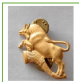
20. Bataillons mærke