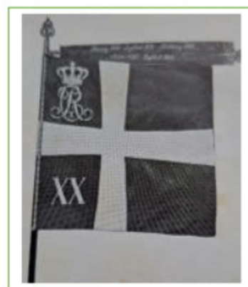
20. bataljons fane

1. Jægerkorps blev beordret til at indgå i et korps, som bestod af flere jægerkorps, 5., 9. og 10. Bataillon, en eskadron og 5. Feltbatteri, som blev indsat i Sundeved, hvor "Slaget ved Bov" fandt sted og medførte, at 1. Jægerkorps mistede 1 soldat – hvis navn i øvrigt var Sejer!