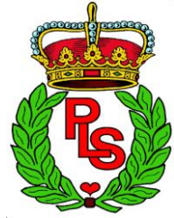
20. Bataillons mærke