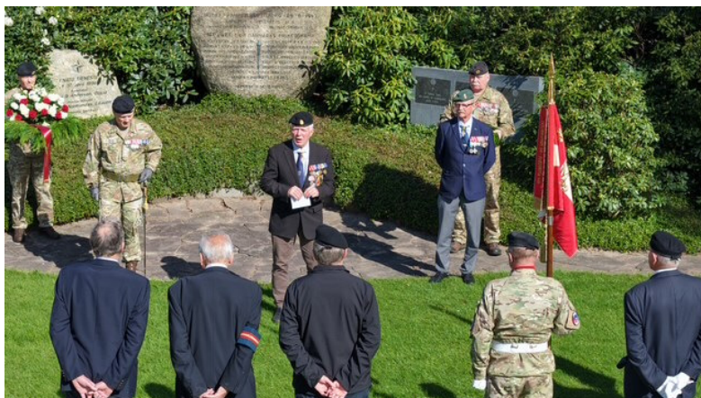
Landsformanden holder tale / Foto: Klavs Niebuhr

Inden kransene blev nedlagt, talte Landsformanden bl.a. om begivenhederne under 2. Verdenskrig.